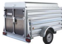
Remolque Cargo con Freno