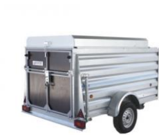
Remolque Cargo con Freno