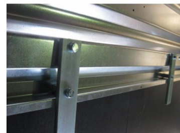
Kit Alzas Desmontables