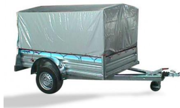
Arquillada con Lona