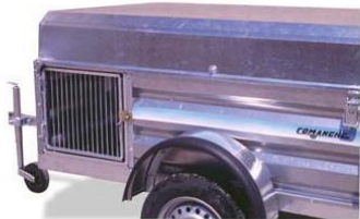
Suplemento Puerta Lateral