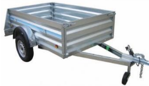
Remolque con Freno