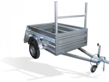
Soporte Frontal Barras